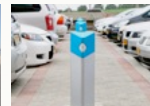
Batterieladestationen von „Better Place“