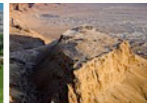
Massada – Felsenfestung des Herodes hoch über dem Toten Meer