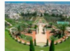
Die Gärten der Babai über Haifa