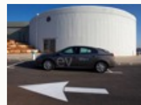
„Better Place“ Vehicle Demonstration Center in Ramat HaSharon.